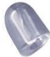
21 gr HOLLOW ICE CUBE

Алматы (7273)495-231 Ангарск (3955)60-70-56 Архангельск (8182)63-90-72 Астрахань (8512)99-46-04 Барнаул (3852)73-04-60 Белгород (4722)40-23-64 Благовещенск (4162)22-76-07 Брянск (4832)59-03-52 Владивосток (423)249-28-31 Владикавказ (8672)28-90-48 Владимир (4922)49-43-18 Волгоград (844)278-03-48 Вологда (8172)26-41-59 Воронеж (473)204-51-73 Екатеринбург (343)384-55-89