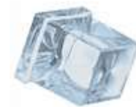
6 / 10 / 17 gr SQUARED ICE CUBE 10 gr.= Standard

Алматы (7273)495-231 Ангарск (3955)60-70-56 Архангельск (8182)63-90-72 Астрахань (8512)99-46-04 Барнаул (3852)73-04-60 Белгород (4722)40-23-64 Благовещенск (4162)22-76-07 Брянск (4832)59-03-52 Владивосток (423)249-28-31 Владикавказ (8672)28-90-48 Владимир (4922)49-43-18 Волгоград (844)278-03-48 Вологда (8172)26-41-59 Воронеж (473)204-51-73 Екатеринбург (343)384-55-89