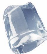
18 gr FULL ICE CUBE

Алматы (7273)495-231 Ангарск (3955)60-70-56 Архангельск (8182)63-90-72 Астрахань (8512)99-46-04 Барнаул (3852)73-04-60 Белгород (4722)40-23-64 Благовещенск (4162)22-76-07 Брянск (4832)59-03-52 Владивосток (423)249-28-31 Владикавказ (8672)28-90-48 Владимир (4922)49-43-18 Волгоград (844)278-03-48 Вологда (8172)26-41-59 Воронеж (473)204-51-73 Екатеринбург (343)384-55-89