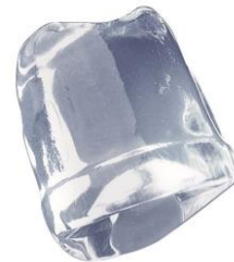
36 gr. FULL ICE CUBE

Алматы (7273)495-231 Ангарск (3955)60-70-56 Архангельск (8182)63-90-72 Астрахань (8512)99-46-04 Барнаул (3852)73-04-60 Белгород (4722)40-23-64 Благовещенск (4162)22-76-07 Брянск (4832)59-03-52 Владивосток (423)249-28-31 Владикавказ (8672)28-90-48 Владимир (4922)49-43-18 Волгоград (844)278-03-48 Вологда (8172)26-41-59 Воронеж (473)204-51-73 Екатеринбург (343)384-55-89